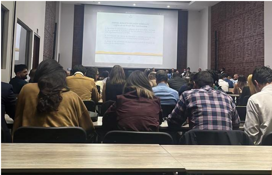
Reunión DH, avances primer semestre 2026